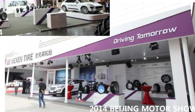
2014 BEIJING MOTOR SHOW