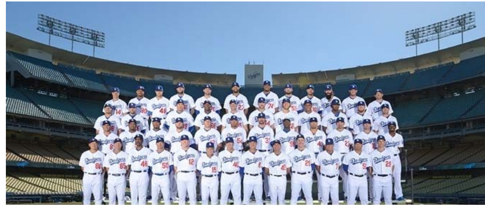
2014 Official Partnership NEXEN TIRE / LA DODGERS

지난해에 이어 메이저리그 프로야구팀 <LA다저스>, <디트로이트 타이거즈>와의 파트너십을 이번 시즌에도 이어가고 추가로 <텍사스 레인저스>와 공식파트너십을 맺고 현지 마케팅을 강화.